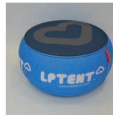
Table-But, forme table-basse