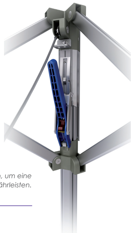
Spannhebel für einfaches Spannen, um eine optimale Dachspannung zu gewährleisten.