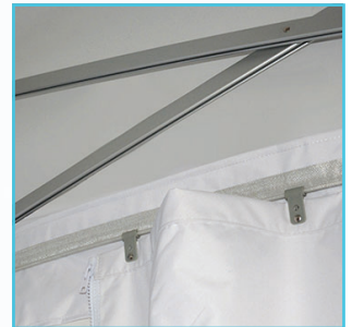
Mur coulissant en partie haute