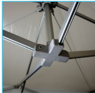
Pièce de connexion injectée fibre de verre.