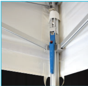
Poignée de verrouillage ZP