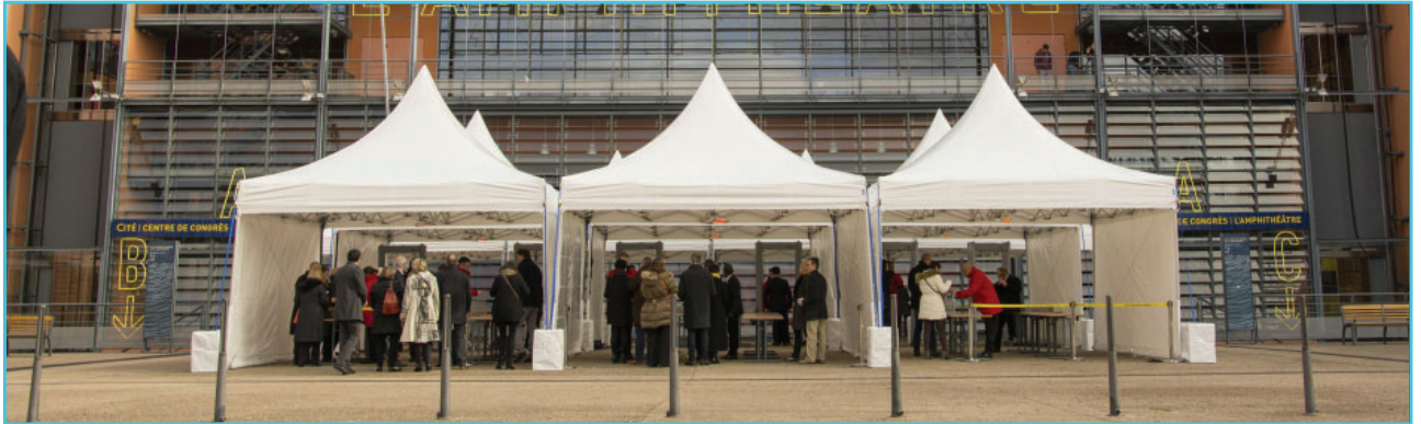
Pagode ZP 5x5m